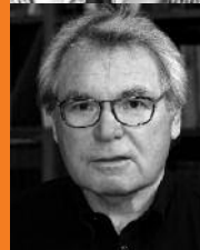
Prof. Dr. Oskar Negt Universität Hannover